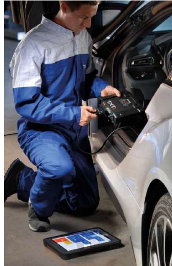
Fig. 3: Utilizzo del sistema di autodiagnosi composto da NAVIGATOR + software IDC5 installato su AXONE