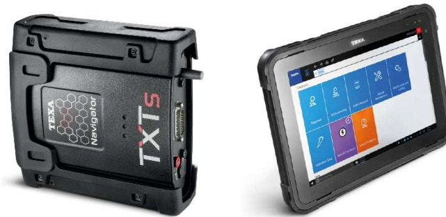
Fig. 1: A sinistra: componente hardware di misura NAVIGATOR, a destra: componente hardware HMI AXONE con installato il software IDC5