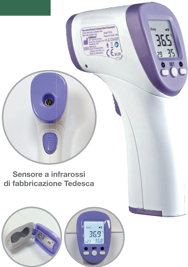
Sensore a infrarossi di fabbricazione Tedesca