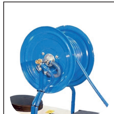
Tubo alta pressione mt 50 con avvolgitubo