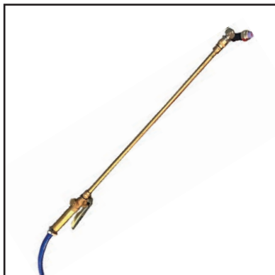
Esclusivo kit lancia con ugello nebbia per una migliore nebulizzazione della soluzione sanificante negli ambienti .