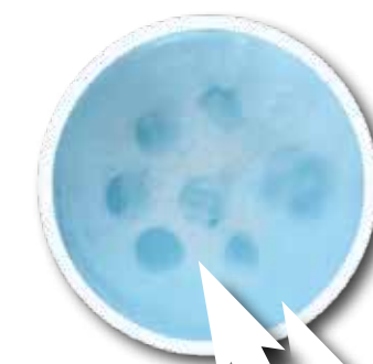
Dopo il trattamento

Per un risultato ottimo e per prevenire problemi respiratori o situazioni allergiche nei passeggeri, si consiglia di effettuare un intervento con AIR+ di TEXA ogni 6 mesi.